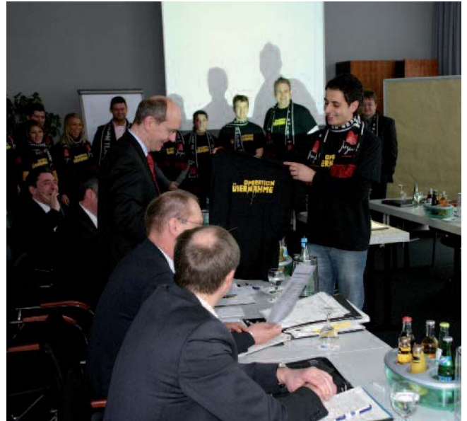
Aktion Übernahme. Auch dran sei noch einmal erinnert: Die IG Metall-Jugend hat mit ihrer Aktion erreicht, dass 130 Auszubildenden der Jahrgänge 2005 und 2006 die Übernahme bei der AutoVision oder einer anderen VW-Tochter gesichert werden konnte.